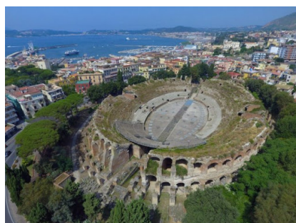
Anfiteatro Flavio a Pozzuoli